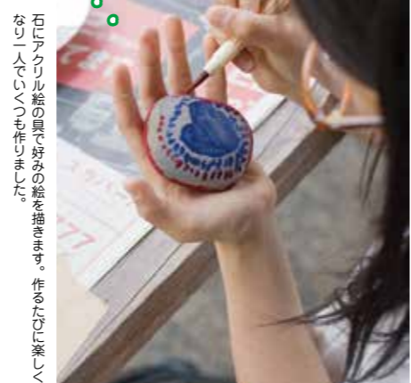
石にアクリル絵の具で好みの絵を描きます。作るたびに楽しくなり一人でもいくつも作りました。