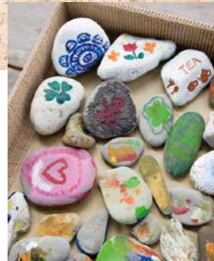
海の丸い石と川の角張った石。自然の形からイメージを膨らませて作ったストーンペインティングの作品。好みの石を家族で探すのも楽しそうですね。