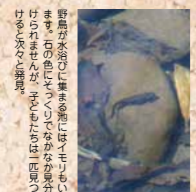
野鳥が水浴びに集まる池にはイモリもいます。石の色とつくりになかなか見つけられませんが、子どもたちは一匹見つけたら次々と発見。