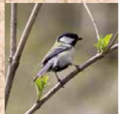
白いほっぺが特徴のシジュウカラ。移動せずに通年ここに生息し繁殖する「留鳥(りゅうちょう)」です。