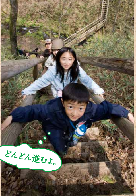
渡った沢の先では、蔵王に降った雨や雪が源となる地下水が岩の割れ目から湧き出し、流れを作る場面にも出会えました。