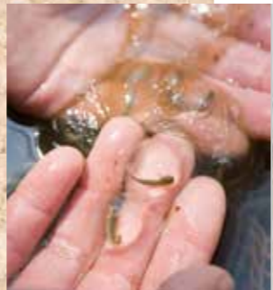
池にはトウホクサンショウウオの卵が。小さなサンショウウオがすくすく育っていました。